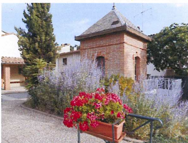
Le Poids Public