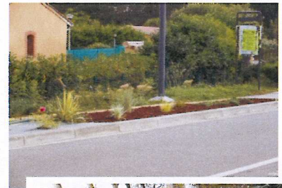
Le nouveau massif créé au carrefour de l'axe principal de Gardouch et du lotissement Saint Ferréol