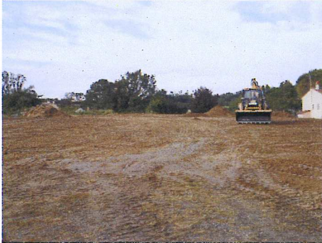
Chemin de la Palanque, le terrain communal en friche avec des amas de terre disgracieux a fait place à un endroit entretenu

L'embellissement de notre commune est l'un des principaux souhaits de la Municipalité et cela commence par l'entrée du village.