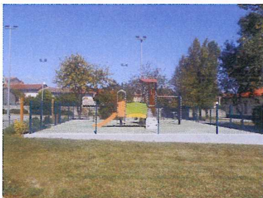
Le centre du village, avec l'Espace François Mitterrand, son aire de jeux et le parvis de la Mairie