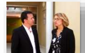
M. Le Maire et Mme L'Inspectrice